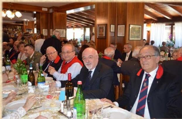
Amici e patroni da Melegnano