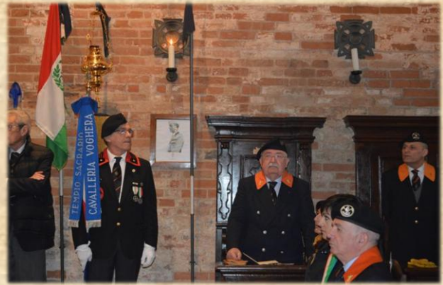
Lo Stendardo del Tempio ed il Priore