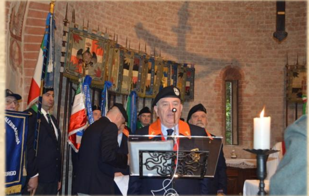
Il saluto del Presidente Nazionale