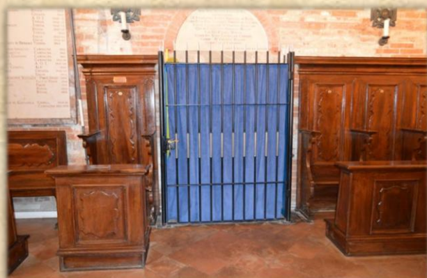
Le due tende doppie davanti ai due impianti di riscaldamento.

1. Rifacimento di tutti i tendaggi. Importo: 1.500,00 euro.