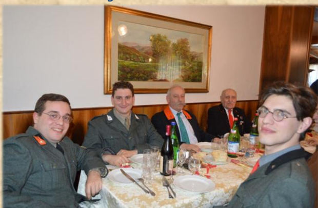
Gli amici dell'Associazione "Soldati al fronte"