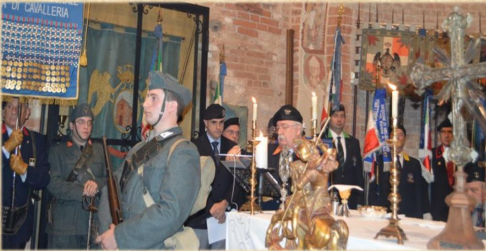
Estratto della Commemorazione tenuta dal Priore:

“... San Giorgio, l’invitto cavaliere romano, è preso a modello della Cavalleria classica che alle sue virtù s’ispira, e nessuno che non praticasse la Pietà verso Dio, il culto dell’onore, la generosità verso il suo pari, la difesa del debole, la giustizia contro la prevaricazione, poté mai dirsi cavaliere. Il mutare dei tempi non cambia la sostanza di tanta fede, sicché ancor oggi nessuno più chiamarsi Cavaliere se non pratica quelle stesse virtù; se - sfrondate le parole - non è un uomo ed un cittadino esemplare. L’Arma di Cavalleria educa i suoi soldati nel culto di tali immutabili valori facendone cittadini capaci di donare se stessi per il bene e la salvezza della Patria.