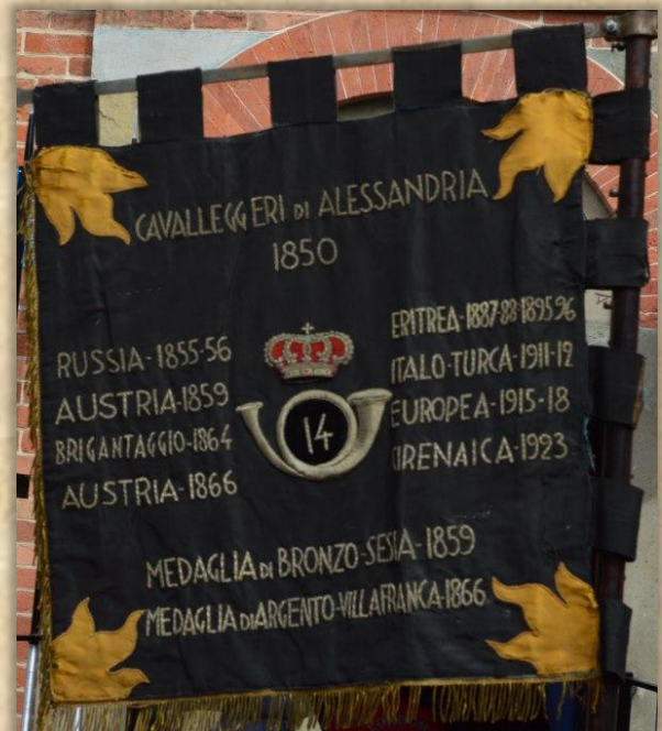
la Colonnella di Alessandria che appare quella in peggiori condizioni.