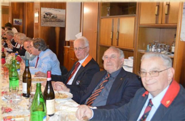
...ancora da Voghera