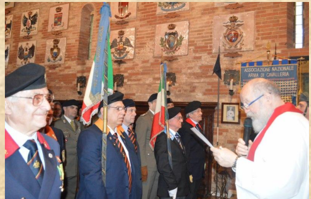
Lo Stendardo di Genova