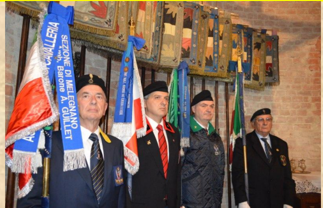
Labari e Stendardi in posizione dietro l'altare