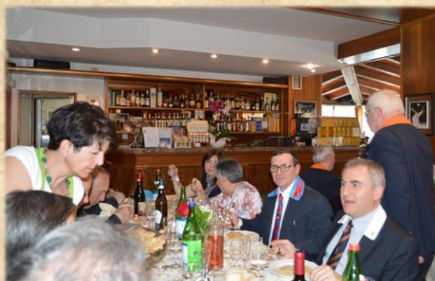
Patroni e amici da Voghera