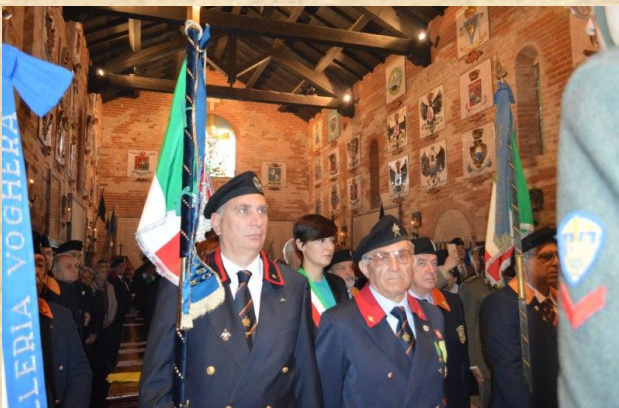
Lo Stendardo di Lodi