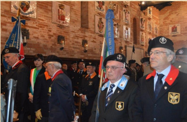
Lo Stendardo di Ferrara