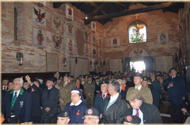
Il Tempio gremito