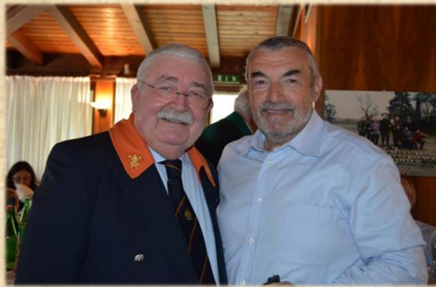
Il Priore in giro per i tavoli