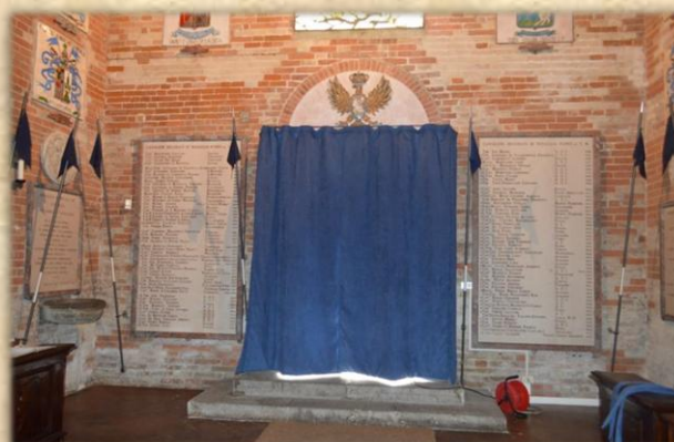
Il tendone imbottito che ripara dal freddo esterno quando il portone è aperto.