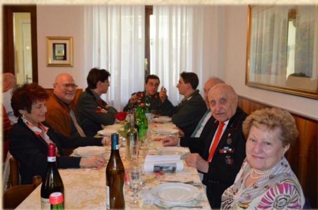
gli amici di Milano