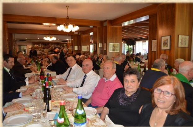
gli amici dell'Emilia Romagna